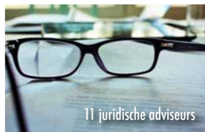
11 juridische adviseurs

We zijn er maar wat trots op: 11 gepensioneerde juristen en adviseurs die onze leden op vrijwillige basis bijstaan met het beantwoorden van vragen en het oplossen van juridische, notariële of verzekeringskwesties. In sommige