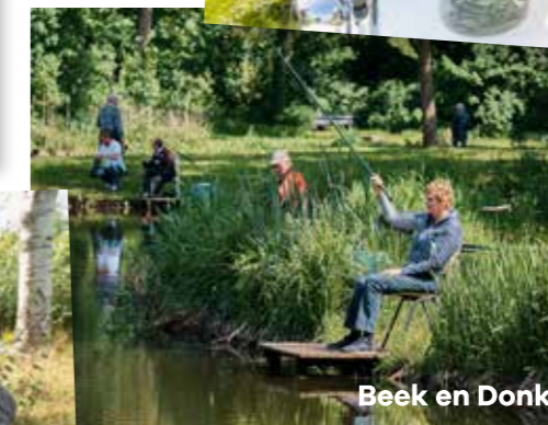
Beek en Donk