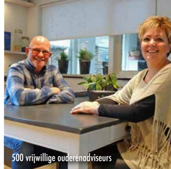
500 vrijwillige ouderenadviseurs

gevallen zelfs tot bij de rechtbank. Bij onze helpdesk kan men terecht met vragen over erfkwesties en testament, problemen met burens, problemen met leveranciers en telefonische verkoop, AOW en pensioen, Wmo, verzekeringskwesties. Ook bestuurders van Afdelingen en Kringen kunnen een beroep doen op de expertise van het juridische team. Op verzoek kan bijvoorbeeld ook een oud-notaris voor een Afdeling of Kring een presentatie verzorgen over testamenten.