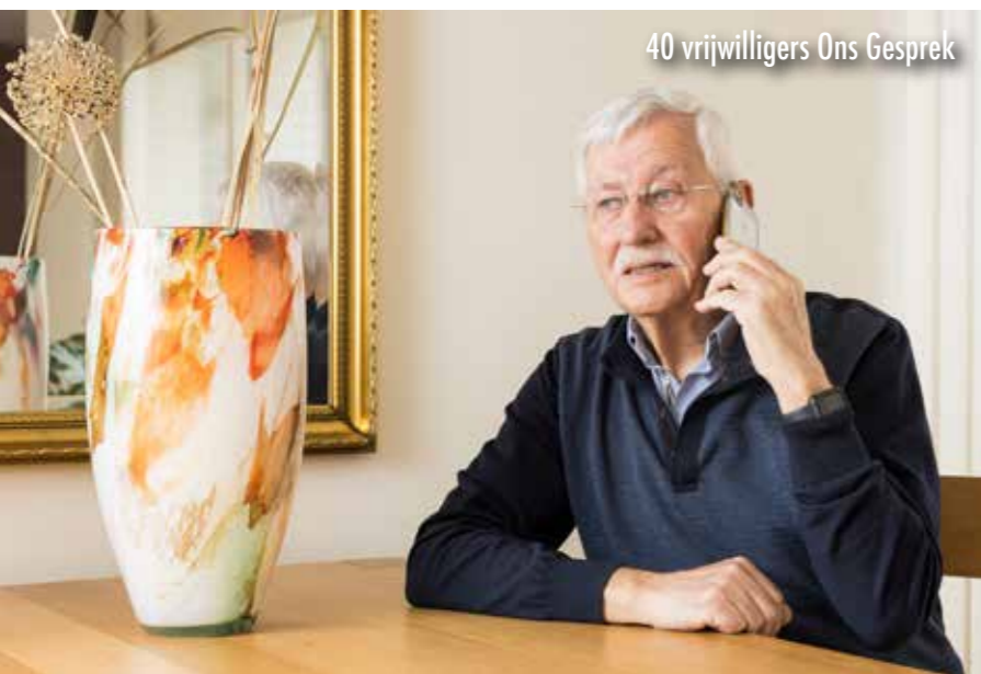
40 vrijwilligers Ons Gesprek