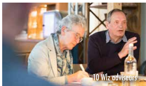
10 Wlz adviseurs

KBO-Brabant heeft deze groep in 2020 opgeleid. Daarnaast hebben we de juridische kennis en kunde in huis als er bijvoorbeeld bezwaar gemaakt moet worden tegen een indicatiestelling. En omdat een indicatiestelling vooral medisch onderbouwd wordt, hebben we ook de daartoe benodigde medische kennis en ervaring beschikbaar.